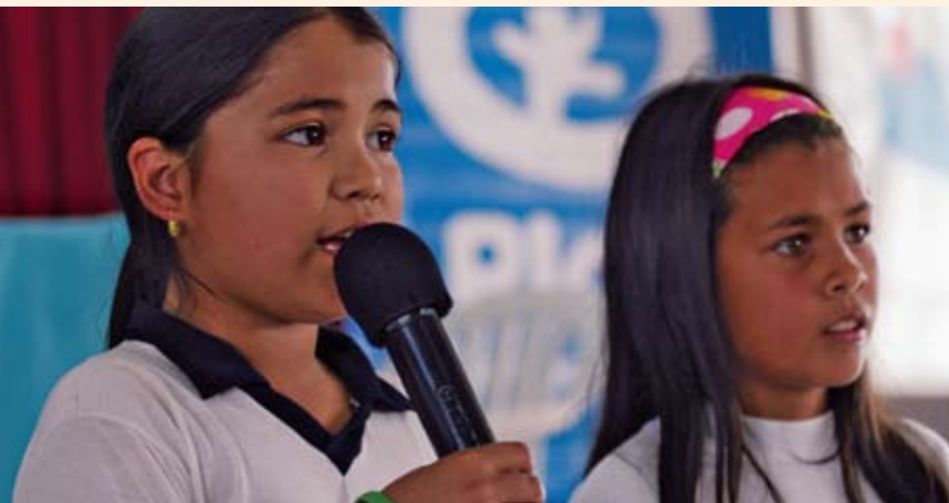
Garotas de um grupo de direitos infantis, Paraguai.